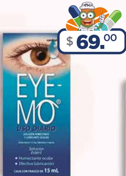
7501089805065 EYE-MO 15 ML.