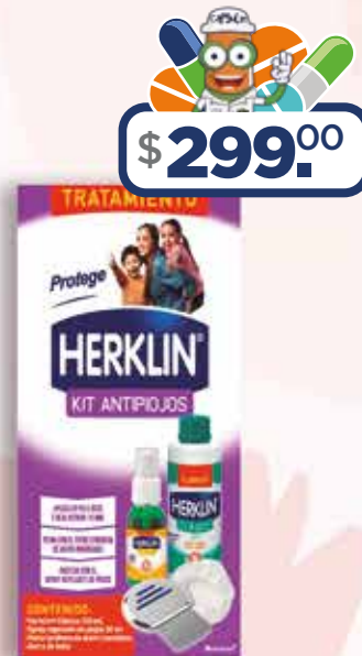
7501089810427 HERKLIN SPRAY 120 ML