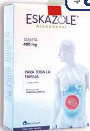
7501089801425 ESKAZOLE 400 MG / 1 TAB