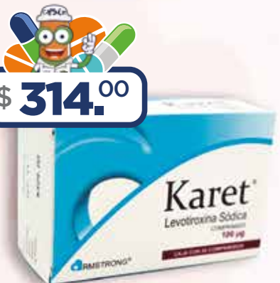
7501089803177 KARET 100 MCG / 50 COMPS