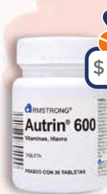
7501089804099 AUTRIN-600 36 TABS