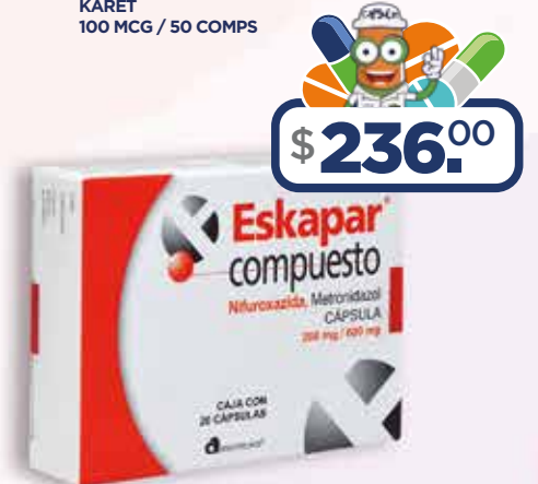
7501089809445 ESKAPAR COMPUESTO 600 MG / 200 MG / 20 CAPS