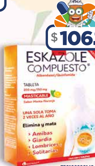
7501089801494 ESKAZOLE COMPUESTO 200 MG / 150 MG / 2 TABS